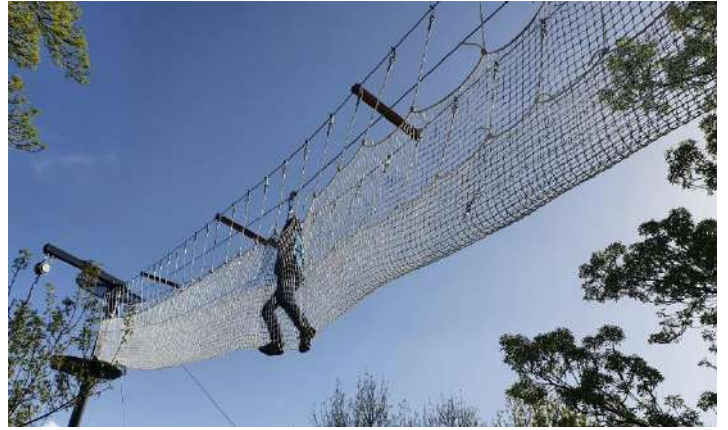
Acceso al salto al vacío por puente aéreo de 40mts