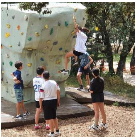
Zona de Boulder

También es recomendable llevar unos pantalones que no sean demasiado cortos para que las perneras del arnés no nos rocen la piel.