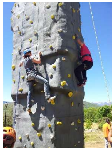
Escalada Rocódromo con cuerda